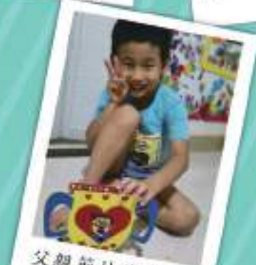
父親節快樂！ 夏朗希