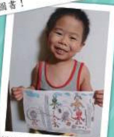
橡面超人拯救地球！ 王傑喬