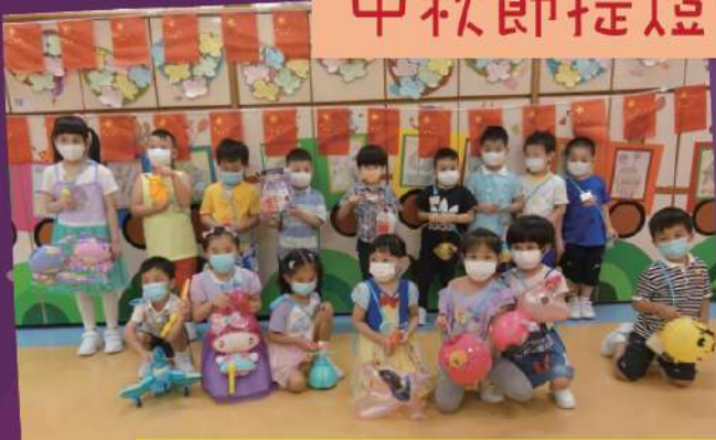
大家一起玩燈籠真快樂啊！