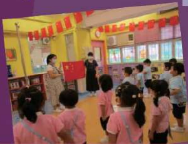
老師向我們介紹國旗的意思。