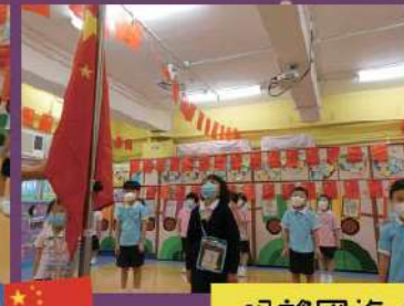
眼望國旗！升國旗，奏國歌。