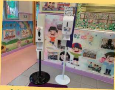
新添置的自動搓手液機及體溫探測機