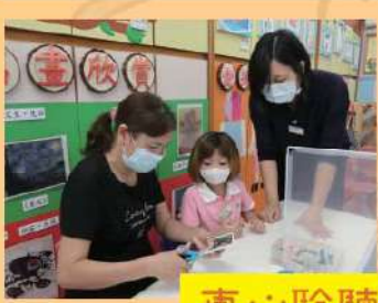
專心聆聽老師的講解!