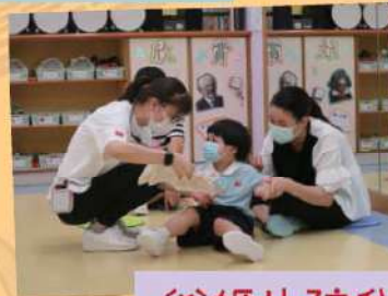
爸媽也陪我一起玩呢!