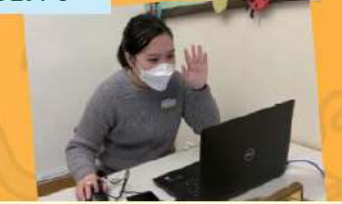
在電腦看見老師和同學真快樂!