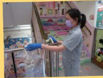
消毒經常接觸的設施