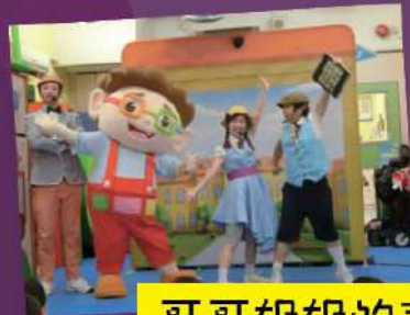
哥哥姐姐的表演很精彩呢！