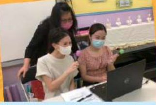
校長也與我們一起ZOOM!