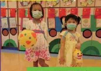
看！我們燈籠的款式各有特色！