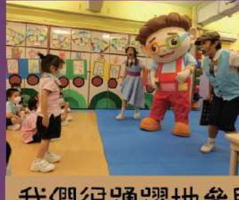
我們很踴躍地參與遊戲啊！